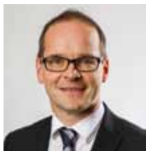
Грант Хендрик Тонне Министър на образованието на Долна Саксония

На тази основа ще можете да вземете информирано решение относно по-нататъшното образование на детето си. Щастливото дете, което е мотивирано да отговори на изискванията на избрания вид училище, трябва да бъде общата ни цел.